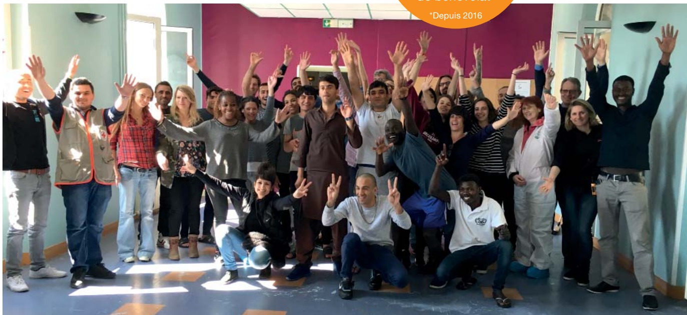
Chantier de rénovation d'une partie d'un centre d'hébergement d'urgence de la Croix-Rouge.

Inventaire de denrées alimentaires, préparation et distribution de repas à des sans-abris avec l'Association l'Un Est l'Autre.